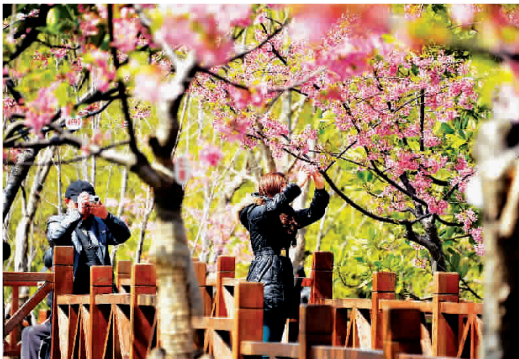
■ 上海市民去顾村公园赏樱花