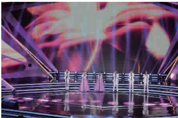
中国地质大学(北京)