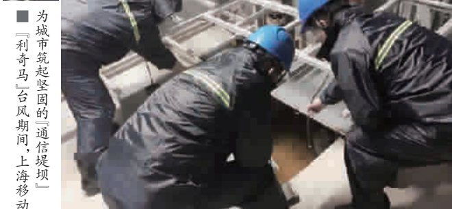
为城市筑起坚固的“通信堤坝” “利奇马”台风期间,上海移动