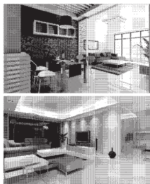
提醒:因为聚通装潢是直属网点经营模式,真正实现“就近装潢”,你只需根据具体情况就近选择适合你的门店为您服务。