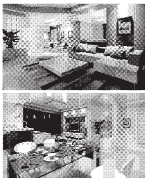
提醒:现场有4辆样板房直通车,供消费者免费参观聚通上海市区38家直属网点在建工地...