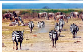
角马和斑马和平相处