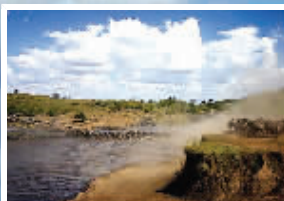
蓝天白云下的马拉河