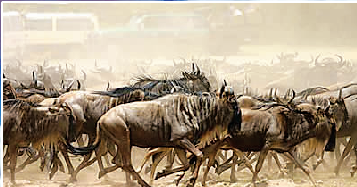
成千上万头角马向马拉河奔去