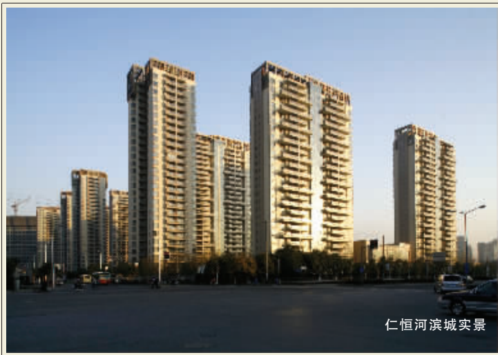
仁恒河滨城实景图

如今,仁恒河滨城二期的规划和开发引入了更新的国际化生活理念,除了坚持原有的价值体系之外,在整体社区配套上进行了进一步尝试。大手笔建造了全面满足健身休闲需要的滨水运动会所,将诸多国际生活必备的元素引入,又引入新加坡邻里中心服务理念,建造独一无二的社区商业生活设计——邻里之家,成为服务整个社区、辐射联洋板块的又一潮流配套。目前其正对外招募知名国际品牌商家,以期与仁恒国际化社区的全球化属性相一致。也就是说,除了做好内置的国际化硬件外,仁恒正在逐步将外置体系纳入整体之中。