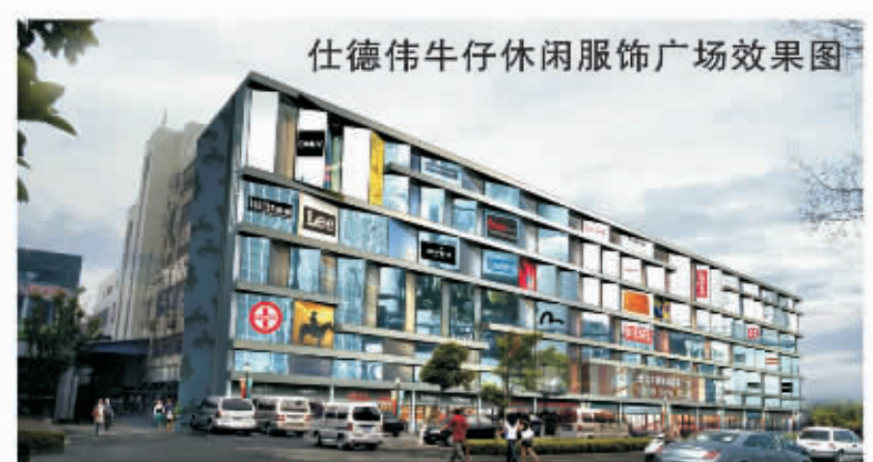
仕德伟牛仔休闲服饰广场效果图

仕德伟牛仔休闲服饰广场在总结招商城批发市场现有经营状况的基础上，充分吸纳国内外同类市场先进的经营理念，不断创新、勇于拓展，以清晰的市场定位、明确的主题特色、完善的管理与服务体系开拓了招商城第五代专业服饰市场先河。