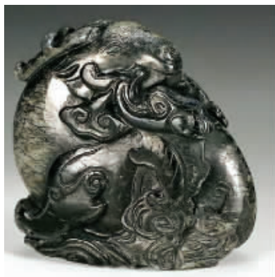
清中期·墨玉鹿衔灵芝摆件