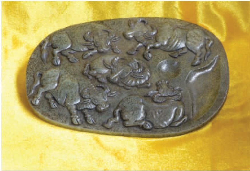
青白玉雕笔舔《五牛图》