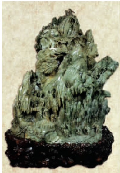
蜜玉山雕《攀登珠穆朗玛峰》