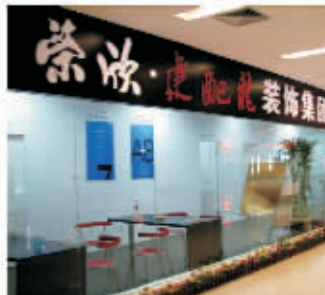
荣欣联手建配龙推出惠民利民的“A+B”