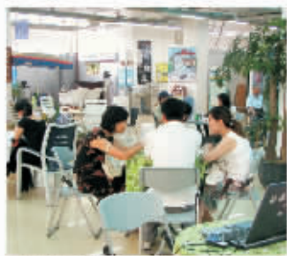
来的都是客，荣欣生活馆有问必答