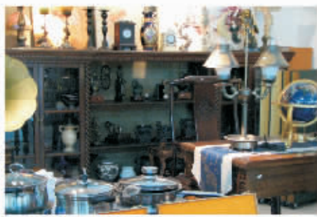
生活馆装潢配套陈设琳琅满目一应俱全