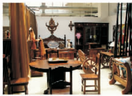
生活馆配套仿古家具均属“原创”孤品

无庸讳言，有关申城千家万户家居的装饰装修，坊间素来颇多唱叹“若要瘦身，家居装修”；“减肥要见效，装修选清包”……，说不清道不明的烦事恼事揪心事，何来装潢还能快乐着？但“老皇历”而今翻却，网上就有博客称此番她装修三房两厅一卫新居，仅一个月即告竣工入住，“是一桩很快乐的事”。