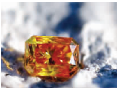
■ 用骨灰制成的钻石

11月12日,国际丧葬业2007年年会在英国城市盖茨黑德举行,中心议题就是探讨遗体处理的多种可能。