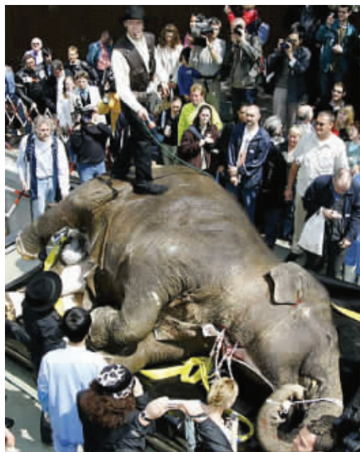
■ 德国教授冯哈根斯正打算用生物塑化技术处理大象的遗体

人们还可以将遗体捐赠给德国解剖学教授贡特·冯·哈根斯。经他发明的生物塑化技术处理后,尸体将化腐朽为神奇,成为他的“人体世界巡展”中的一件作品。据称,生物塑化技术可以保存尸体长达4000年之久。