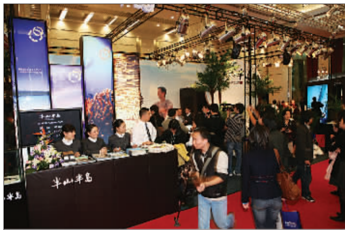
半山半岛惊艳亮相本届 Top Marques。

“上海,作为半山半岛全球推广的第二站,具有特殊的战略意义。”半山半岛营销总监徐能力说。“由于