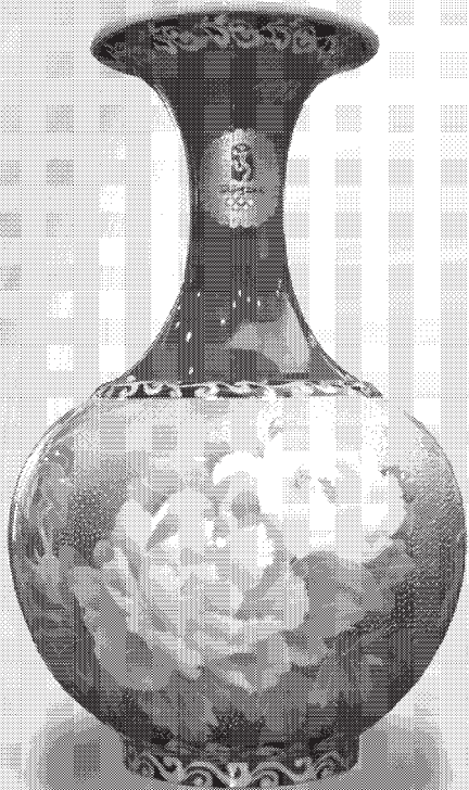
奥运瓷·花开富贵瓶

——知名瓷艺师采用纯手工打造,煅烧次数高达8次,冲破中国瓷器烧制的“技术瓶颈”,是中华五千年陶瓷艺术的集中体现。从数百位艺术家的眼光中,在众多陶瓷器型里精挑细选出兼具传统、创新、具有现代美感的V字口(象征胜利)的天球赏瓶!意喻圆融、圆满、圆润。瓶形高贵典雅,是收藏、传家、祈福、馈赠的上佳之选。