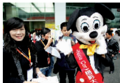
“Nice Car”社团请来了米老鼠为他们的摄影大赛做宣传