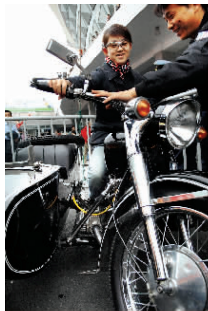
黑蝙蝠摩托车俱乐部的“坐骑”吸引不少年轻人的关注

表演很热闹,互动节目更吸引人。上海东方男篮拉拉队NANA TEAM的专业教练现场为大家教授简单易学的健身舞蹈。在单车嘉年华区域,刺激的试骑体验让观众大开眼界。工作压力大,今天在健康单元,专家为白领青年讲解自我减压课程,为他们量身定做健康法则。