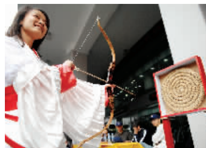
汉末央汉服俱乐部让青年人知礼仪,强体魄