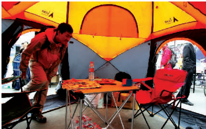
登山俱乐部里有帐篷体验区