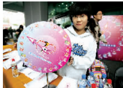
十二星座的撞针盘很受时尚男女的欢迎