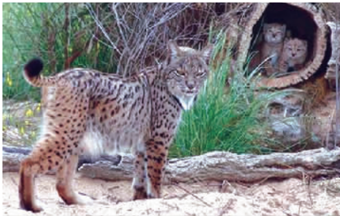
■ 伊比利亚猞猁新种群以树洞为家