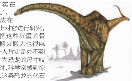
■ 最大恐龙的复原图

科学家把新发现的恐龙命名为“巨大恐龙”。这项研究的负责人表示：“这是迄今为止世界上发现的最巨大的恐龙化石之一，应该也是在恐龙生活时代最巨大的恐龙之一。”参与恐龙化石研究的美国密歇根大学教授杰夫·威尔逊也惊讶地表示：“我要再强调一下它是多么的巨大，即使是它的一小块骨头，对于我们来说也是不可思议的型号。由于它实在是太大了，我们没法在试验台上对它进行研究，就算要把这些沉重的骨骼化石搬来搬去也很麻烦。一个人肯定是办不到的。”在为恐龙的尺寸叹服的同时，科学家感到惊喜的是，这条恐龙的化石保存相当完好。 青云