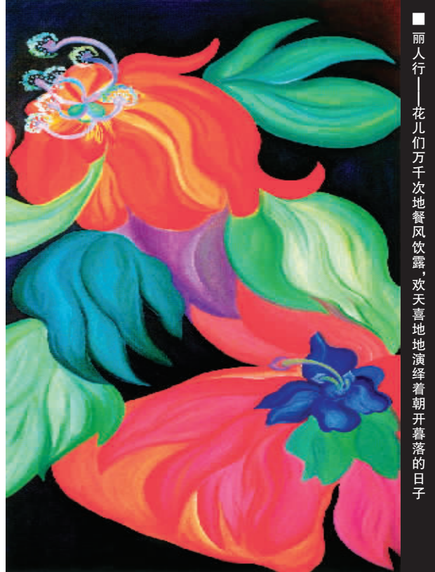
■ 丽人行——花儿们万千次地餐风饮露,欢天喜地地演绎着朝开暮落的日子