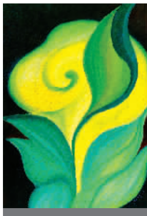
■ 初春——从第一声的呼唤到固守约定的最后一个暗夜,都是为如期实践这个永恒的约会吗?