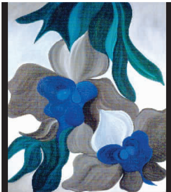
■ 相望——任寒来暑往,她依然是那个被爱密密缠绕住的囚