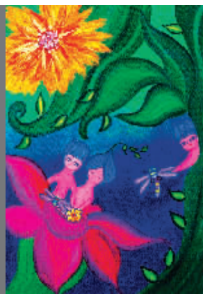
■ 迷境——她慢慢睁开眼睛,立刻就听到了小虫子的欢声笑语