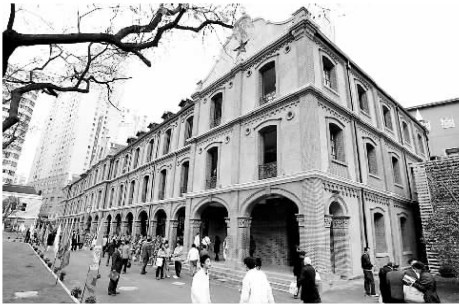
市文管委有关专家表示，第四中学的这次改造很成功，有关经验有很大的借鉴意义

本报讯 (记者 王蔚) “太像了，太好了，就是这个样子。”今天是上海第四中学 140 周年校庆日，始建于 1917 年的启明楼重现当年身姿。一大早，踏进校园的一群耄耋校友见了连声称赞。