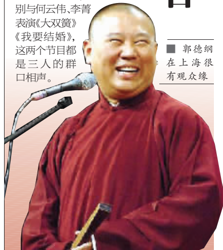
郭德纲在上海很有观众缘

该专场演出以对口相声为主。郭德纲的节目以这一两年的新作品为主,包括《四大名著》《我要旅游》等,他和于谦还将分别与何云伟、李菁表演《大双簧》《我要结婚》,这两个节目都是三人的群口相声。