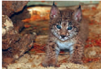
■ 好奇的小伊比利亚猞猁