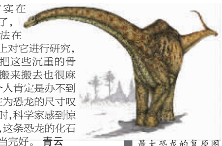
■ 最大恐龙的复原图

科学家把新发现的恐龙命名为“巨大恐龙”。这项研究的负责人表示：“这是迄今为止世界上发现的最巨大的恐龙化石之一，应该也是在恐龙生活时代最巨大的恐龙之一。”参与恐龙化石研究的美国密歇根大学教授杰夫·威尔逊也惊讶地表示：“我要再强调一下它是多么的巨大，即使是它的一小块骨头，对于我们来说也是不可思议的型号。由于它实在是太大了，我们没法在试验台上对它进行研究，就算要把这些沉重的骨骼化石搬来搬去也很麻烦。一个人肯定是办不到的。”在为恐龙的尺寸叹服的同时，科学家感到惊喜的是，这条恐龙的化石保存相当完好。 青云