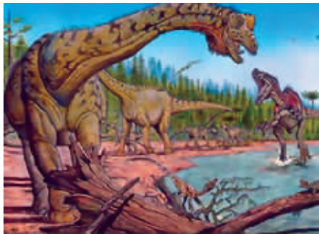
■ 新恐龙是一种两栖大恐龙，以树叶和青草为食

我们都知道有些恐龙的个头大得吓人。那么，迄今所发现的最大恐龙究竟有多大呢？前不久，古生物学家在阿根廷发现了世界上最大的恐龙的化石。据科学家推测，这头恐龙生前有34米长，看上去就像一辆小火车；这种恐龙有13米高，足足有4层楼房那么高。