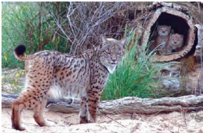
■ 伊比利亚猞猁新种群以树洞为家