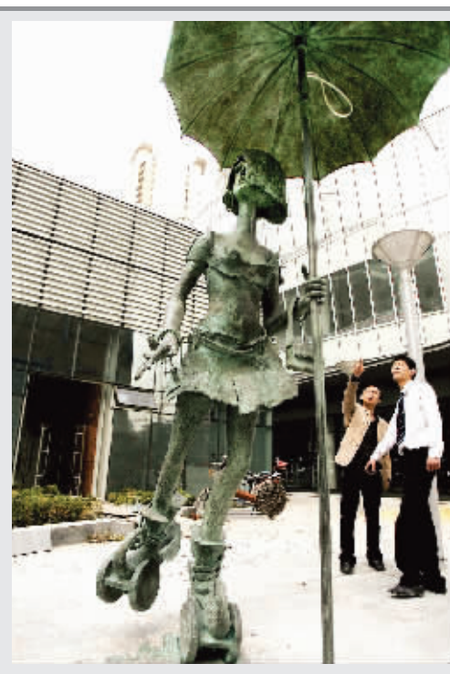
“少女群像” 落户吴江路

近日,3件2.6米高的“骑车少女”“滑轮少女”“静立少女”主题雕塑悄然落户建设中的吴江路休闲街。少女雕塑由法国艺术家苏泰创作,脚踏滑轮,手执阳伞,栩栩如生。据工作人员介绍,吴江路休闲街将于6月底完成施工,向公众开放。