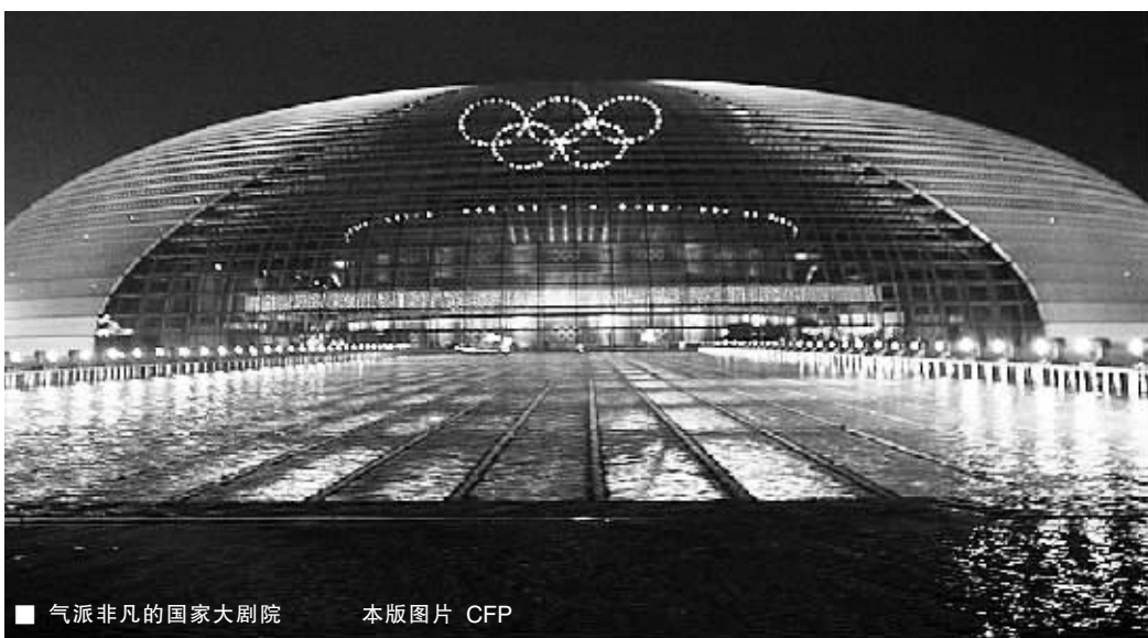
■ 气派非凡的国家大剧院

新奥运,也为中华大地带来了新景观、新气象:首都机场 T3 新航站楼、“鸟巢”、“水立方”、国家大剧院……一座座地标式的高大建筑,屹立在中国的首都北京。