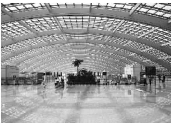
■ 宽敞明亮的 T3 航站楼