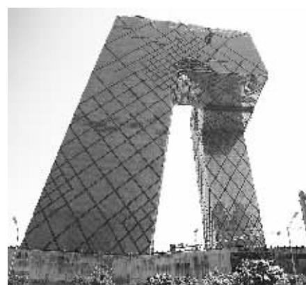
■ 构思巧妙的中央电视台总部