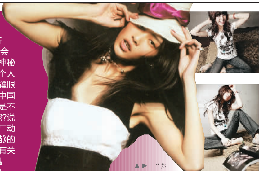
“熊猫”热后,黑白两色成了本季的主打色