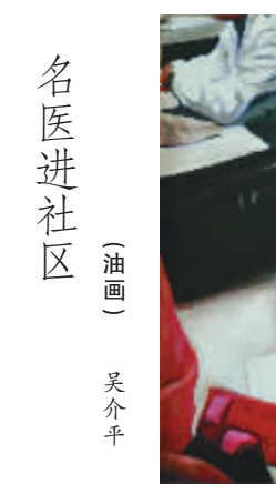
名医进社区 (油画) 吴介平

淳子讲，伊顶顶写上海，顶顶写上海女人，想来必是肺腑之言。偏偏一写已是漠漠二十年，从轻熟写至老熟，无论笔致抑或情致。翻淳子的书，漫卷尽是海上繁花，胭脂点点，那些苍苍岁月里，曾经名动四海的上海女子，一个个在伊笔下活色生香，细