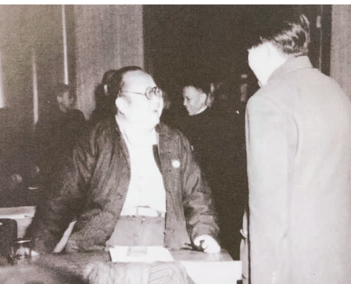
▲1951年10月至11月，在中国人民政治协商会议第一届全国委员会第三次会议上，毛泽东与潘光旦交谈。