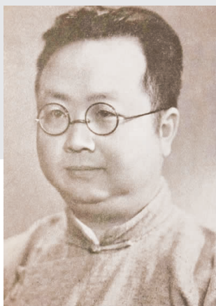
▲上世纪30年代，潘光旦曾任清华大学教务长、图书馆馆长。

宝山区罗店镇迄今已有700多年历史，具有浓厚的文化底蕴，享有“金罗店”美誉之称。近年来，罗店镇正全力打造长江口上的中国历史文化名镇。为进一步突出文化惠民利民，坚持以“文香罗店”为主题，打造“春有花神秋有画、夏有龙船冬有灯”的四季文化品牌，传承先贤精神、发掘文