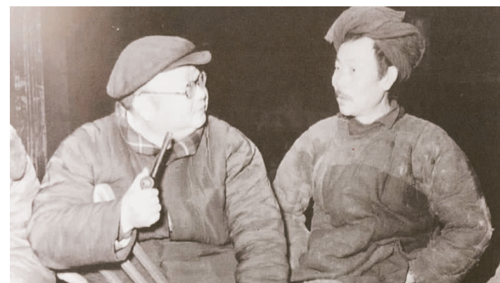
▲新中国成立后，潘光旦转向民族学研究。他克服身体残疾的不便，跋山涉水。图为他与鄂、湘、川交界地区的土家族老人聊家常。