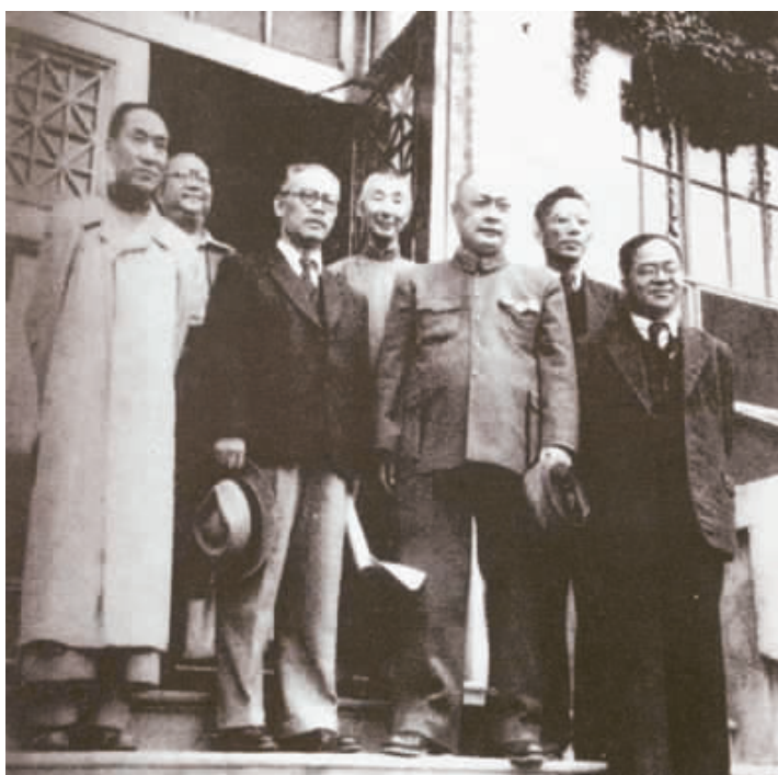
▲1949年10月3日，陈毅参观清华大学时在图书馆门前留影，自左至右：叶企孙、潘光旦、张奚若、张子高、陈毅、周培源、吴晗。