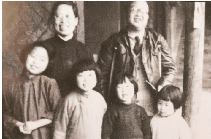
▲抗战期间，潘光旦任教西南联大，以优生学研究闻名。潘氏夫妇与女儿们在昆明。