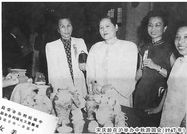
宋庆龄在沪举办中秋游园会(1947年)

今年6月14日是国家名誉主席、孙中山夫人宋庆龄创建的中国福利会(其前身组织先后为保卫中国同盟和中国福利基金会)80周年纪念日。对这一历经风雨、作用独特、与时俱进的人民团体,宋庆龄曾倾注了大半生的心血。她亲自领导该组织在不同时期都追求一个共同目的:“把我们经验所得,尽可能广泛地传播出去,为人民服务。” 抗战胜利后,保卫中国同盟由重庆迁至上海,更名为中国福利基金会,宋庆龄继续担任主席,从各方面竭诚支援正义力量。与此同时,她还在申城热忱关怀文化界进步人士,尽力扶贫济困。