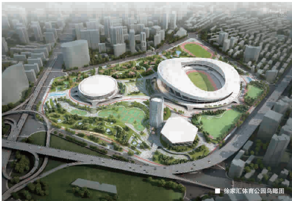
徐家汇体育公园鸟瞰图

根据规划方案,徐家汇体育公园将保留和改造上海体育场、上海体育馆、上海游泳馆和东亚体育大厦四栋主要建筑,其余建筑基本拆除。上海体育场改造后仍然作为一座能够承办综合性运动会的体育场,在继续办好中超联赛上港俱乐部主场、国际田联钻石赛上海站的基础上,进一步提高利用率,培育引进足球、橄榄球、棒球、攀岩、壁球等其他顶级赛事;上海体育馆通过改扩建,提升功能,满足乒乓球、羽毛球、篮球、排球、斯诺克等赛事要求,创造条件引进拳击、自由搏击、电子竞技等娱乐性、观赏性强的新兴体育赛事;上海游泳馆保持原有游泳池、儿童泳池等功能,满足游泳、跳水等项目的青少年业余训练;东亚体育大厦改造主要用于满足体育公园运营管理办公要求,