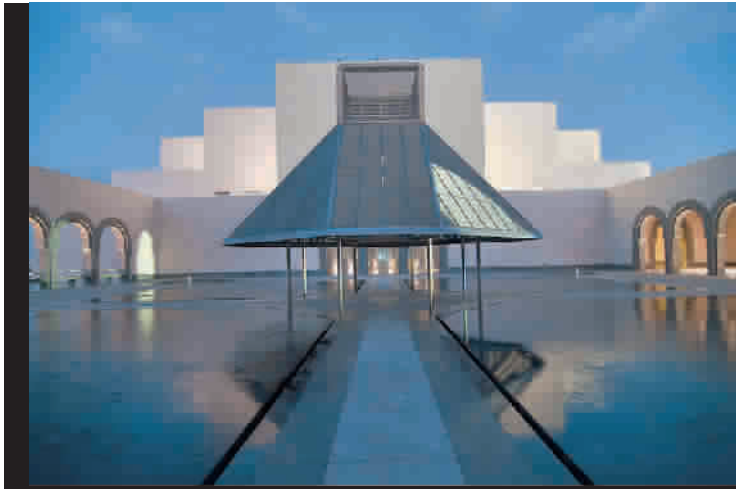
■ 贝聿铭设计的伊斯兰艺术博物馆

林璠的设计是“用一把刀切开华盛顿宪法公园的一个缓坡”,让岩石裸露出来,纪念越战的“越南墙”被设计成两面巨大的抛光黑色大理石墙,墙体扇形张开,两面各76米,形成125度的夹角,交汇处最深,3米多;墙充分利用了地形与空间的特点,犹如一面巨形似刃的镜子嵌在隆起的地层里,构成一个巨大的“V”字,渐渐渐浅,慢慢绘成一个湾,“V”字两翼一端指向林肯纪念堂,另一端指向华盛顿纪念碑。黑色碑身上镌刻着58132个阵亡将士和失踪者的姓名。多少年来,那些越战老兵、阵亡者家属走进