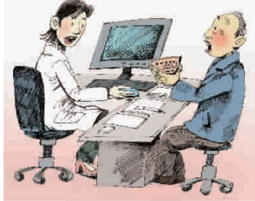
陆坚敏 文 田红 图

原本以为孩子只是排斥上幼儿园，谁料他周五晚上去参加原本喜欢的课外的辅导班，也变得情绪很不稳定，哭嚷着要回家。韩先生这才意识到事态的严重性，孩子厌学。“小孩目前根本离不开我们。老师打他，对他的身心造成很大影响了，那我们一定要替孩子讨要说法。”当天，韩先生夫妇连夜带着孩子去医院