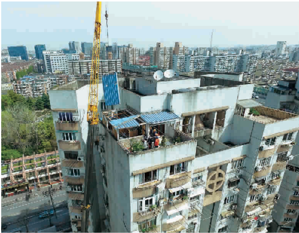
■ 上午九时,静安区保德路921弄某号楼顶违建被拆除