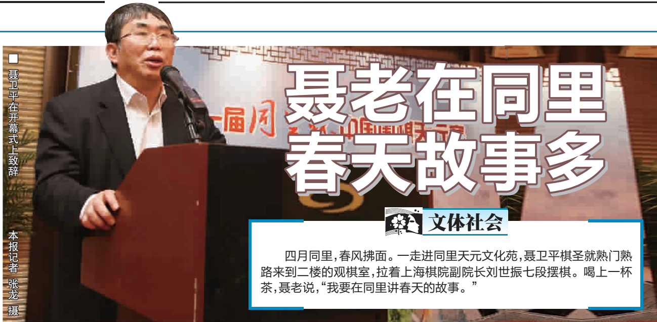
聂卫平在开幕式上致辞