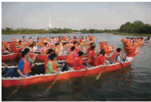
年7月2日至8日举办2017“新民晚报小记者夏令营”活动。

它给孩子们带来的不仅是知识的提升和见识的增长,更是一次难得的学习机会和深刻实践。