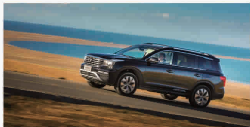
旗舰级豪华大7座SUV 传祺GS8

广汽传祺一季度取得高端SUV销量新“祺”迹,将成为实现年销50万辆目标的加速器,并再次奠定了作为中国汽车品牌高端领跑者的业界地位。四月份,备受瞩目的上海车展开幕在即,广汽传祺将狂推六款新车,集中展现中国汽车品牌高端与新能源智造实力,引领中国汽车品牌持续向上突破!