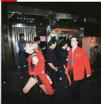
■ 从今我也是中国人了