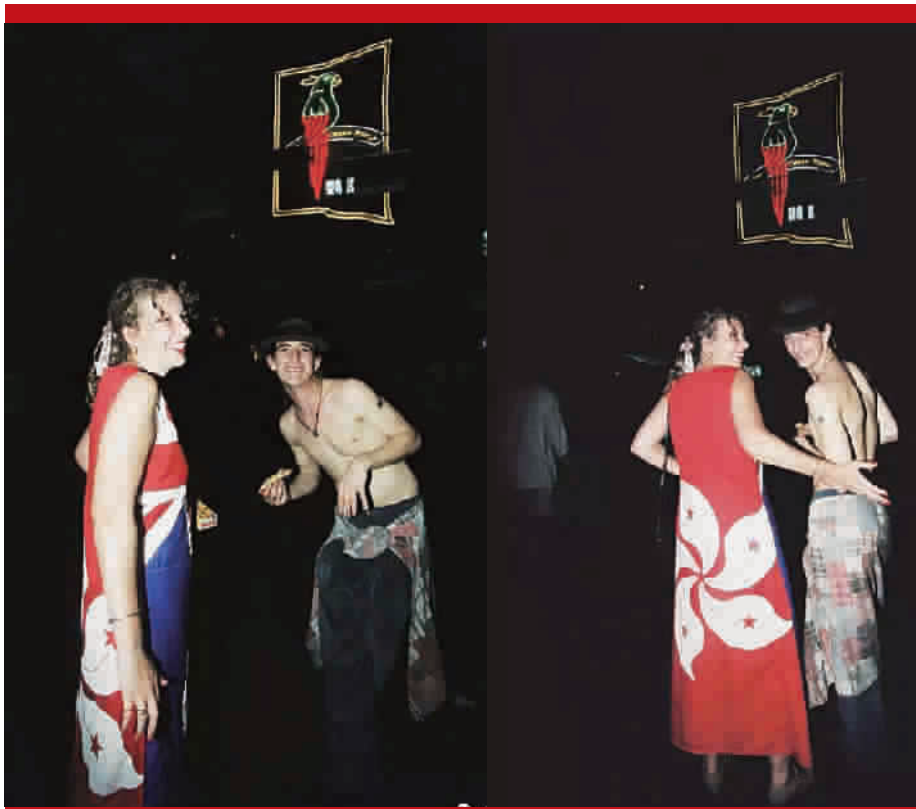
■ 身前身后安然衔接的时装

当晚我拍完政权交接仪式,基本没休息就去香港著名的酒吧一条街兰桂坊酒吧拍摄,那里热闹异常,聚集了大批各国年轻人,我拍照时他们都特别开心,纷纷给我摆 pose,本版第一张照片中女士手里《大公报》号外的照片,是一个小时前(1997年7月1日零点)我在香港会展中心中英香港政权交接仪式上拍摄的(报纸上的照片是使用第一代数码相机拍摄的,也是我们第一次将数码相机应用于报道,可以说是图片数码时代的开端)。很多洋人问我是哪里人,我说是 china,他们纷纷向我竖大拇指,那一刻我感觉到作为中国人的自豪,也感觉到一个国家只有强大才是硬道理!