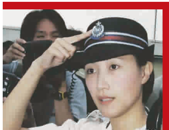
■ 回归前夕,香港警察向媒体展示回归后将佩戴的新警徽

回首 1997 年 7 月 1 日零点,是激动人心的时刻——香港终于回归了!我当时就在香港会展中心,参与中英香港政权交接仪式的拍摄工作,这一晚港九无眠,我终身难忘。