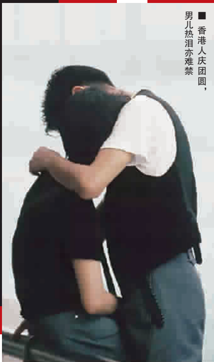
■ 香港人庆团圆,男儿热泪亦难禁