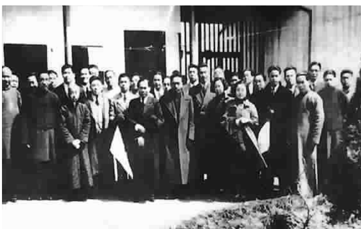
1937年6月25日七君子案件第二次开庭审理。沈钧儒、史良、邹韬奋、王造时、章乃器、沙千里、李公朴、罗青等排成一行，表情肃穆。图为上海各界代表到看守所看望七君子