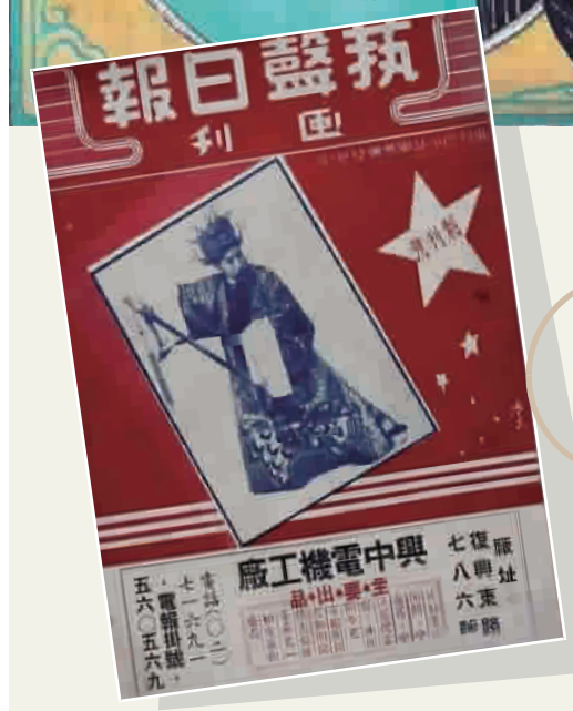
“老杂志创刊号精品展”部分展品