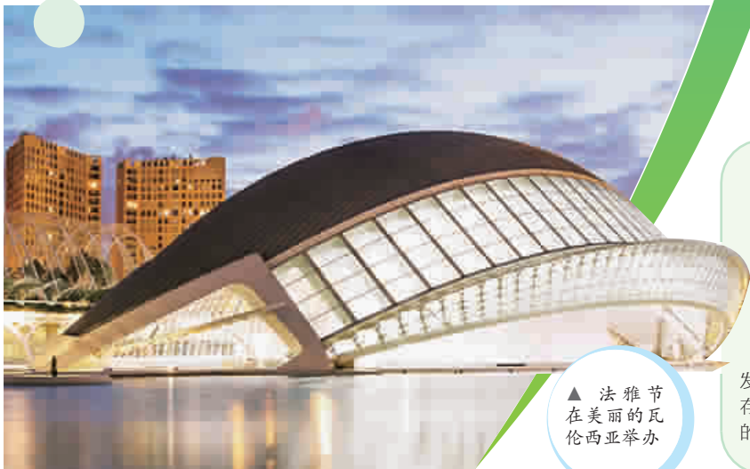
▲ 法雅节在美丽的瓦伦西亚举办

据西班牙世界报消息，去年4月3日，电影《篮球冠军》在西班牙上映，这部聚焦精神残疾人的电影斩获了西班牙2018年票房冠军，荣获多个奖项。故事围绕ACB(西班牙职业篮球甲级联赛)教练展开。当桀骜不驯的篮球教练遭遇一群精神残疾人球员，一场令人动容的“闹剧”暖心上演……该片作为西班牙“申奥”的佳作，近期有望引入中国。 伊人