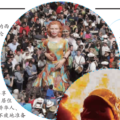
人山人海的法雅节

法雅节的重头戏是焚烧法雅。3月19日，除了评选出来的第一名法雅可保留一小部分收藏在博物馆，