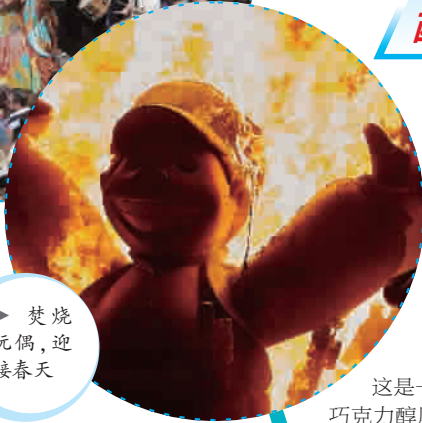
焚烧玩偶，迎接春天

其余法雅都要被烧毁。大火标志着整个节日的高潮。看着巨大的人偶被火焰逐渐吞噬，化为灰烬，让人觉得着实惋惜，不少女孩甚至伤心落泪。不过，更多人在欢呼，有的在乐队伴奏下跳起了舞。送走人偶，预示着美好的春天来了！