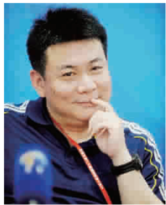
上海人蔡斌带领江苏女排变阵 变来胜利

蔡斌一变,上海就输球。这一方面说明蔡斌的换人恰到好处,技高一着,另一方面说明我们年轻的教练还有点嫩。