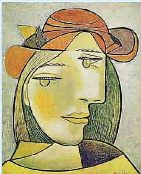
▲ 毕加索《玛丽·泰蕾兹》