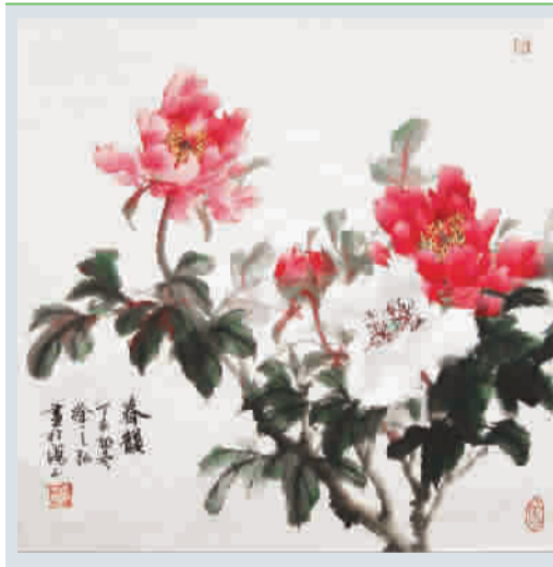
花鸟虫鱼 春韻 (第三百五十五期) 刊头国画：徐之弘

那段时间我心里难过，看见冰箱里还有为它保鲜的虾仁就伤心。其实早在10天前，女儿就发现了两只乌龟离家出走“找主人”去了，她怕我知道后影响身体健康，一直瞒着我。没想到的是，就在我出院后的第5天，早晨我起床打开门，却发现乌龟挨在门口，等待回家。它出走15天后，竟然自己摸回家来，我感叹道：奇迹，奇迹呀！