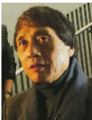
安藤忠雄 图 TP

从职业拳击手到世界建筑界最高奖项——普利策奖获得者，安藤忠雄一直致力于建筑美学与都市进程之间的对话与和解。昨天下午，上海震旦博物馆正式开馆，被冠誉为“混凝土诗人”的他在这个自己亲手打造的“文化宝盒”中为记者作导览，滨江美景与内心宁静在此因他的努力而交融。