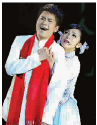
音乐剧《断桥》剧照

作为全国历史最长的区域文化演出交流平台，本届演出交易洽谈活动吸引了全国文艺表演团体、演出经纪机构和演出场所近700人参加，提供演出交易的节目达千余台。活动期间，举办了长三角演出市场发展论坛。通过两天的交易洽谈，签订的合同和意向数量达6000余场，比上届增长了五成。