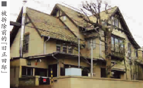
被拆除前的「旧正田邸」

“历史和文化城市建设研究会”认为,由于大多数“近代建筑”没有纳入国家、东京都或所在区的文化财,而是属于个人和企业私产,使得反映近代日本旧貌的建筑物大片消亡,令人扼腕。