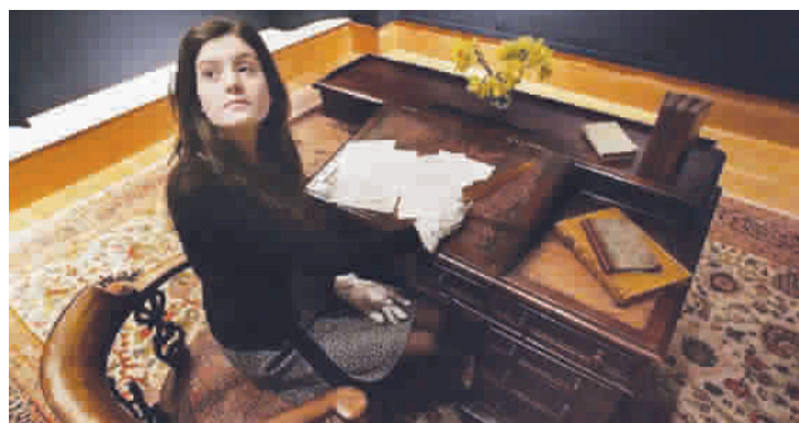
■ 狄更斯故居中展出他当年创作《远大前程》时曾用过的桌椅

遗产保护最主要的资金来源,每年为新保护项目投资约3.75亿英镑。基金会由英国议会设立于1994年,至今共资助了近3.2万个项目,累计投资47亿英镑。