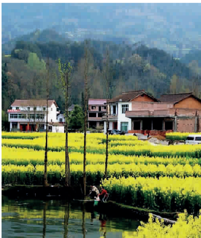
■ 岸上的油菜花黄了

具体行程:第一天:上午乘D3056次动车抵汉口,下午游荆州古城,晚宜昌登顶级豪华游船,尽情享受船上豪华设施。第二天:参观三峡大坝,登上最高点坛子岭,纵览大坝春景;中午游船过三峡大坝船闸,呈现眼前的是峡谷春景,柳垂堤岸,油菜花黄,梨花初放,春意扑面;过第一峡——西陵峡,景致愈益美丽,春光更显浓郁;晚赴船长欢迎酒会。第三天:抵湖北巴东,换乘当地观光游船神农溪。神农溪全长60公里,沿途接纳17条溪涧,8处百米瀑布,由此向南穿行于深山峡谷之中,最后注入浩浩长江。乘着古老的“豌豆角”小扁舟顺水漂流,但见两岸多呈80至90度的绝壁,陡峭耸峙,形成龙昌峡、鹦鹉峡、神农峡三个险、秀、各具特色的自然峡段;峡中深潭碧水、飞瀑遍布、悬棺栈道、原始扁舟、土家风情、石笋溶洞无不令人惊叹。返船进第二峡——巫峡和瞿塘峡;巫峡绮丽幽深,以俊秀著称,船行其间,宛若进入奇丽的画廊,充满诗情画意;瞿塘峡是三峡中最短的一峡,但也是最令人屏息的一段江峡,两岸如削,岩壁高耸,大江在悬崖绝壁中汹涌奔流,自古就有“险莫若剑阁,雄莫若夔”之誉,不过在春风下险峻中添了妩媚。第四天:抵丰都,上岸游览中国唯一的鬼文化发祥地、号称阴曹地府的丰都鬼城;晚举行送别宴会。第五天:抵重庆,游山城吊脚楼、洪崖洞、白公馆、渣滓洞等,山城的春天别有一番意境。第六天:乘KK73次火车返程,也可选择飞机,差价另补。第七