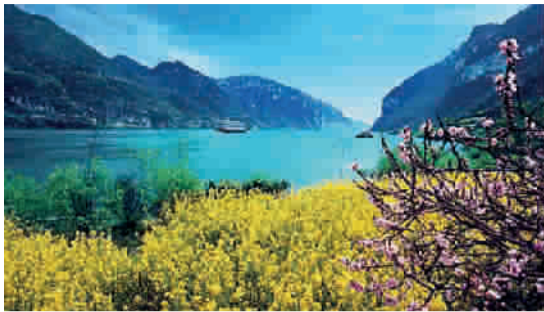
■ 三峡两岸春意盎然