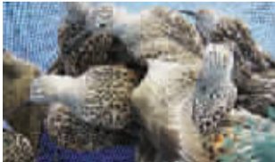
■ 这些捕获的鸟已飞了6000公里