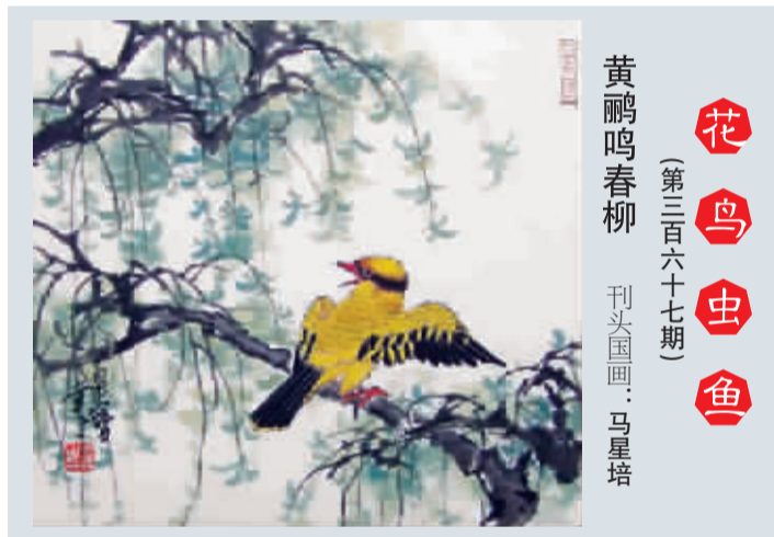
黄鹂鸣春柳 (第三百六十七期) 刊头国画:马星培

目前,野生鸚鵡的数量已极其稀少,被列为国家一级保护动物。让我们对这些可爱的小家伙们多一份爱心,多一点无私。因为它们是我们全人类共同的朋友!