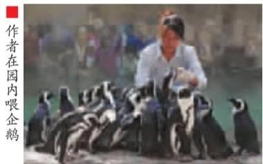
■ 作者在园内喂企鵝

羽毛,还会围着她不停地唱情歌。还会见缝插针地用树叶、树枝、小石头等建造爱巢。有时游客会丢进一些花草,他会马上捡来送给26号,以此博取芳心。经过三个月的追求,26号终于同意交往。之后他俩便出入成双,形影不离,一副甜蜜恩爱样。