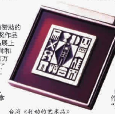
台湾《行动的艺术品》

2004年4月，由上海城隍珠宝特约赞助的“国际时尚翡翠首饰设计大赛”的获奖作品在第三届“两岸三地”珠宝玉器精品展上一展风采。世界各地的知名珠宝设计师和他们的看家之作汇聚上海。价位在百万以上的珠宝首饰就有几十件，吸引了众多收藏家和时尚界人士。其中一件名为“直言翠语”的饰品，在设计师的打造下，翡翠的神秘与冷艳融入了现代的时尚元素而更具魅力，一举拿下大赛金奖。