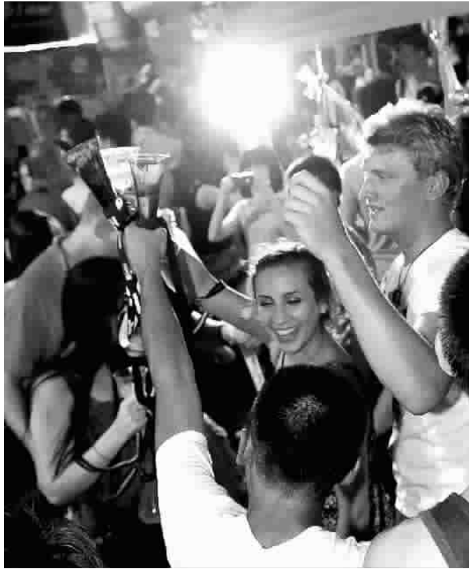
兰桂坊音乐啤酒节

“香港夏日盛会”还推出许多清凉爽酷的派对。兰桂坊音乐啤酒节现场有超过50个摊位和3个表演舞台,提供各色美食及美酒,配上精