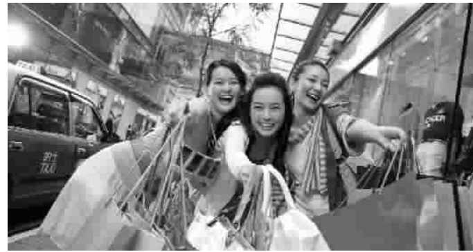
“购物天堂”今夏优惠多

今夏,香港还为内地游客准备了多重优惠礼遇,你可在各大景点与商街,酷玩、潮买、美食,享受诱人折扣。如有“Visa go购物狂赏”活动,游客用Visa卡消费,达到一定