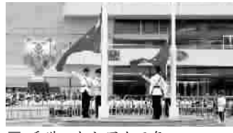
香港回归祖国十五年

金额即可参加抽奖,领取购物现金礼券,更有精选优质商户的尊尚礼遇。购物达人还可参加“Visa go购物王大赛”,争夺20万港币Visa签账额的大奖。为增加游客兴趣,香港旅游发展局推出了“香港乐·吃·购”优惠券,此券汇集15个景点、商户的游乐、美食和购物,让游客走到哪、玩到哪、吃到哪、购到哪。除此之外,其他大商场购物中心也纷纷推