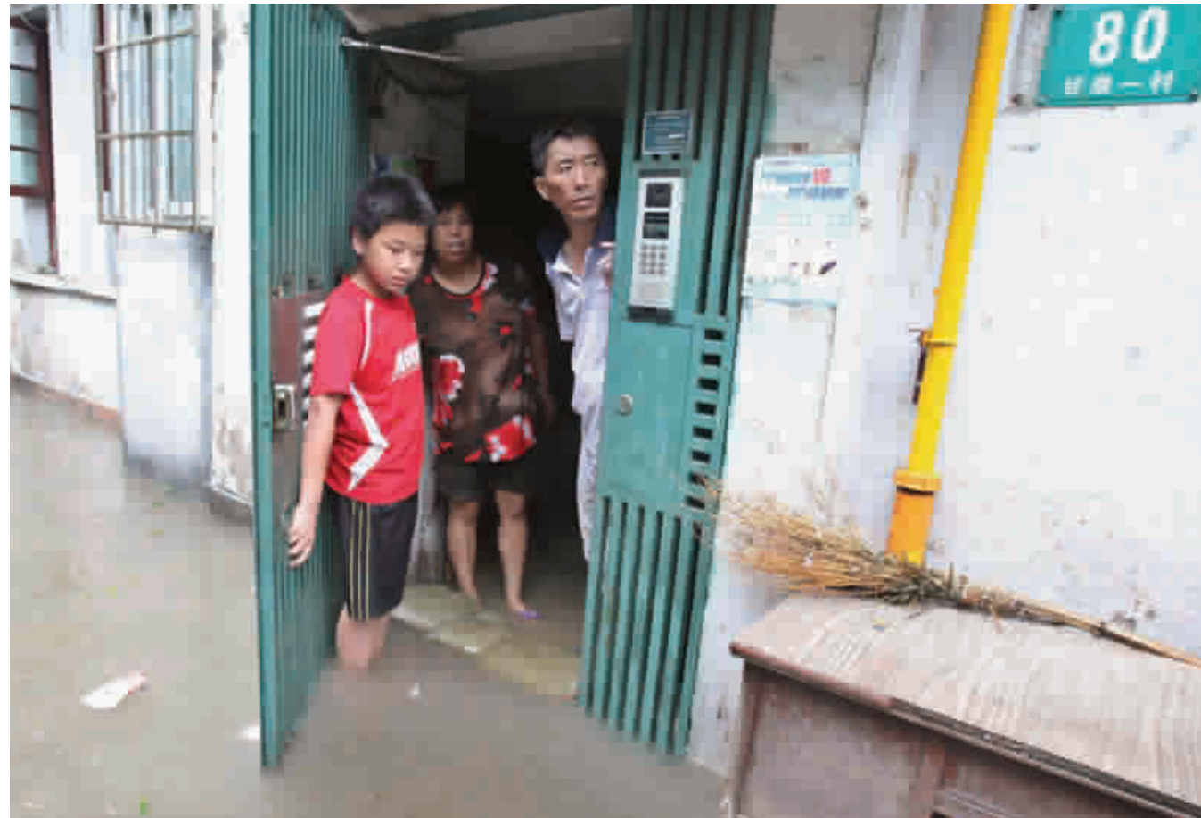
■ 普陀区志丹路228弄甘泉一村(57—85号),积水涌入居民楼房中