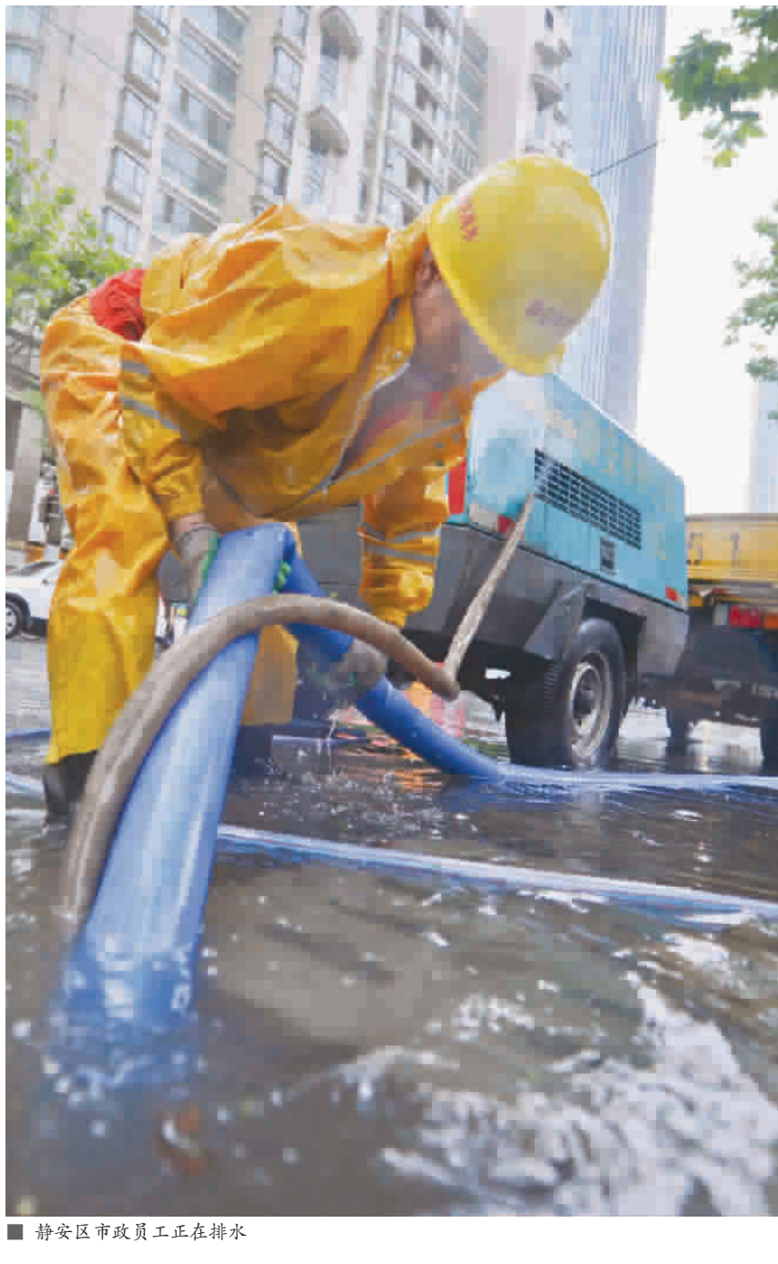
■ 静安区市政员工正在排水

昨天下午2时许,申城天空突然乌云密布,随着风力逐渐加大,豆大的雨点也一起倾泻下来。记者来到杨浦定海地区的平凉路军工路,这里是上海容易积水的地区之一,几条小弄堂内已经发生了居民家进水的情况。