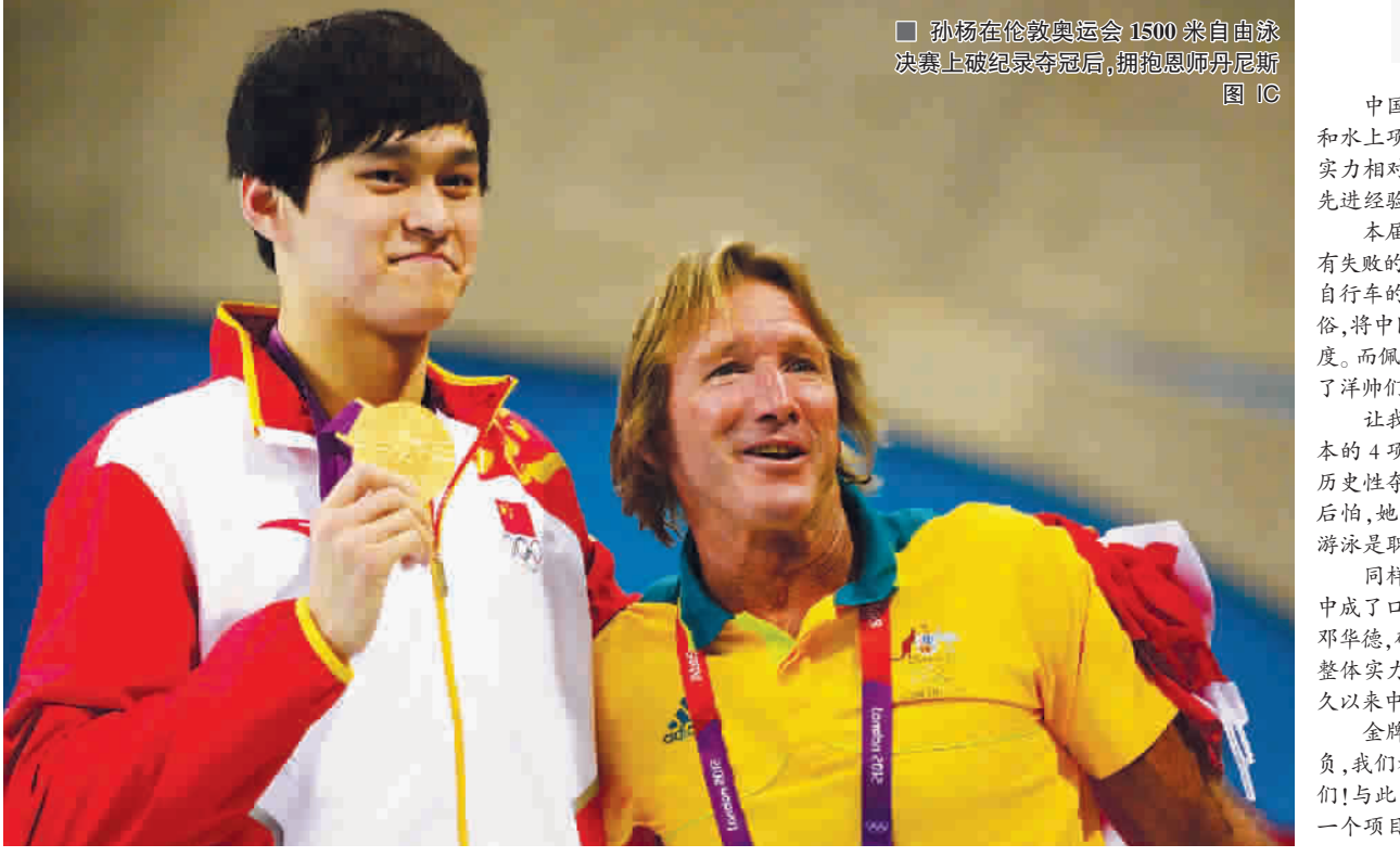
孙杨在伦敦奥运会1500米自由泳决赛上破纪录夺冠后,拥抱恩师丹尼斯