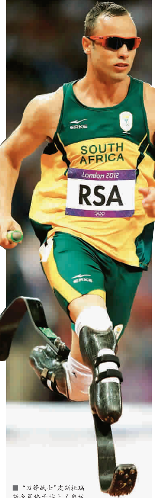
“刀锋战士”皮斯托瑞斯今晨终于站上了奥运决赛跑道