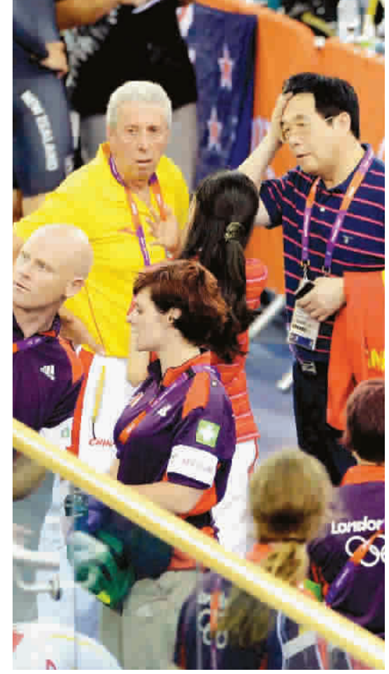
中国佩剑洋帅塞派西(左)一筹莫展 图TP