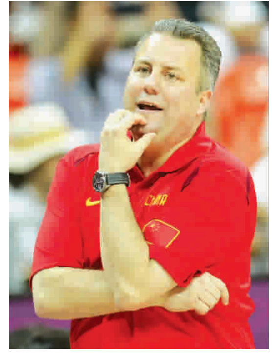
中国男篮一败涂地,邓华德苦无对策 图IC