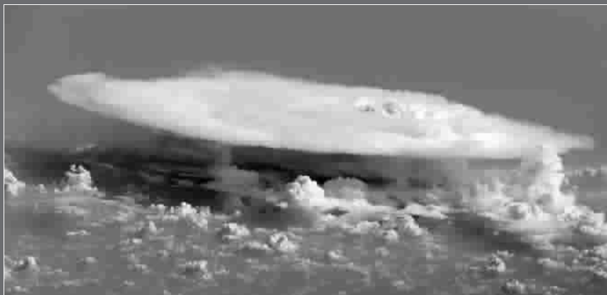
非洲西部上空的积雨云