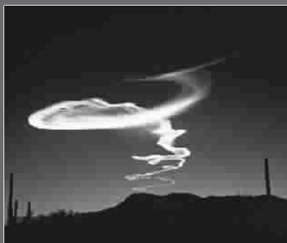
出现在落日与地平线夹角在 6-15 度之间的夜光云