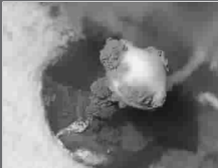
俄罗斯千岛群岛火山爆发时火山灰上的菌盖云