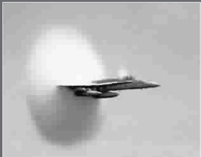
美国 F/A-10 大黄蜂战斗机飞越太平洋时产生的音爆云