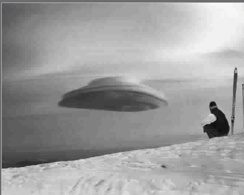
荚状高积云像盘旋于高空中的“飞碟”

一种原子武器被引爆产生的链式反应会把地面加热到很高的温度,导致热气体和碎片上升成为柱形物。柱形物吸入冷空气后形成一个向内螺旋涡,酷似蘑菇帽,直到再次回落下来。李忠东