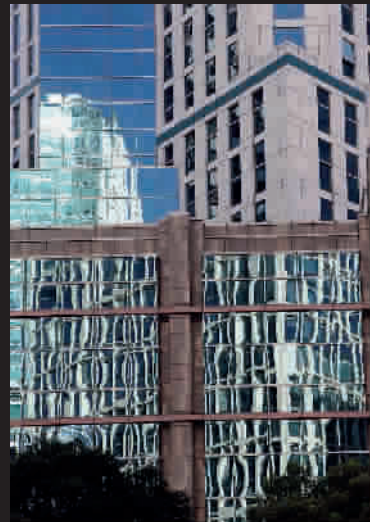
■ 反射的影子像奇妙的符号