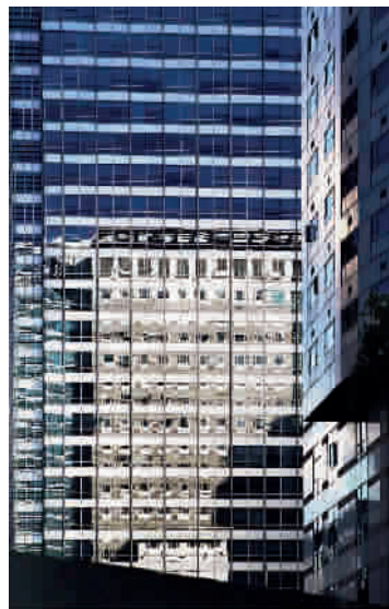
■ 反射的影子像一个个音符