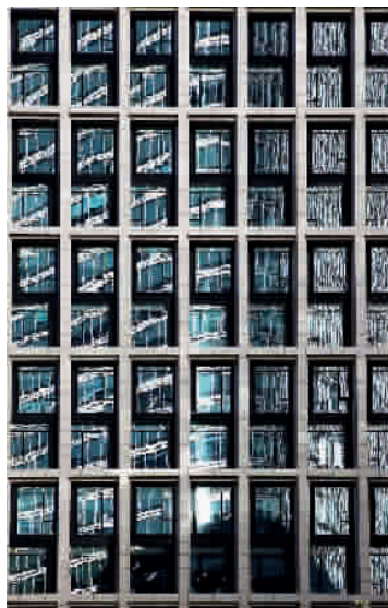
■ 反射的影子形成有规律的音符