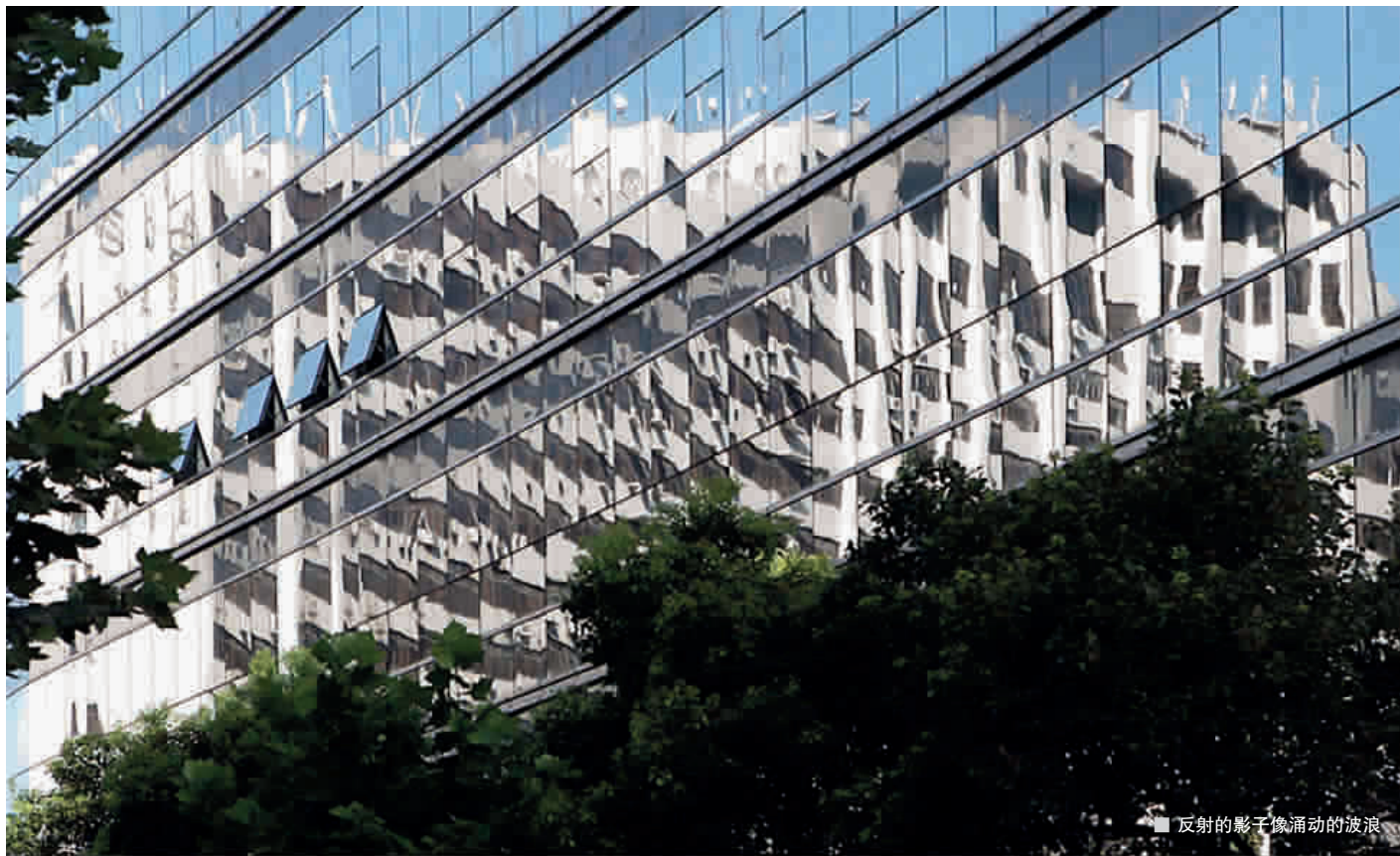
■ 反射的影子像涌动的波浪