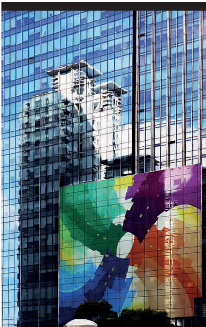
■ 画中有画，玻璃的反射与彩色图案