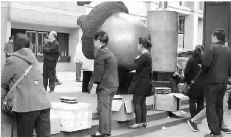
■ 会展门口的台阶上摆满盒饭摊