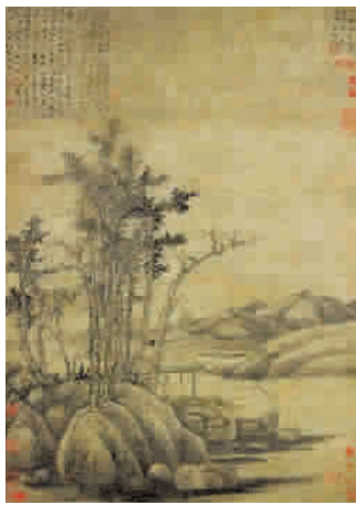
唐棣的《摩诘诗意图》