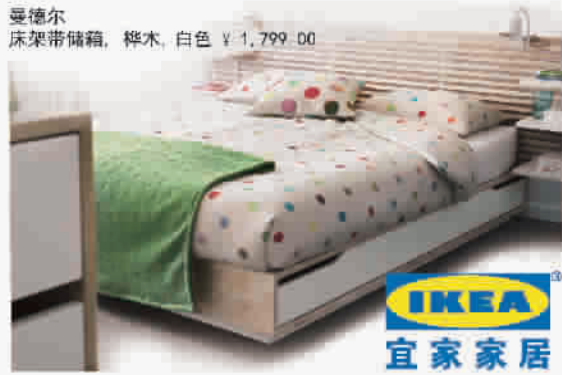
曼德尔 床架带储物箱,桦木,白色 ¥ 1,799.00

原色的木板,桦木的质地,保留木材的自然本色,经久耐用。中空的床架内配置了抽屉式储物箱,在季节交替时可以摆放被子和毛毯,根据气温的变化随意拿取,不再苦恼于气温高低反复所带来的床品更换问题,贴心又实用,还为卧室节省了很多空间。