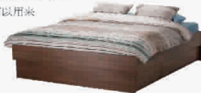
奥普多 床架带储物箱,中褐色 ¥ 1,599.00

一张king size的大床,带来优质的睡眠体验,可以随心所欲地摆出各种pose,释放最真实的自己。而在细节之处,床头板和床架下都设置了储物空间。床头隔板则可以用来收纳电子产品的遥控器。床板下的储物箱则可以摆放换季时替换的棉被、毛毯,把卧室打理得妥妥有条。