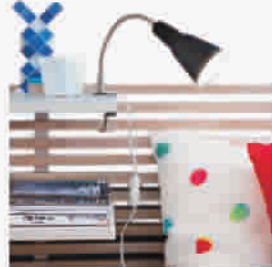
曼德尔 床头板,桦木,白色 ¥ 1,000.00

不妨尝试一下原木的家具,中性的不乏柔和。而独具匠心的床头板设计则巧妙地替代了传统的床头柜,简洁的布置配以自然的色彩与图案,身边还有T4的陪伴,整个卧室都洋溢着自然、温馨的氛围。